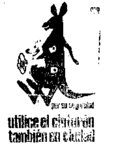
utilice el cinturón también en la vida

Este sacerdotismo al mundo del boxeo marcó también al sacerdote, quien comenzó a actuar como árbitro hasta obtener de la Federación Italiana la licencia correspondiente, que le habilita para dirigir combates entre boxeadores aficionados.