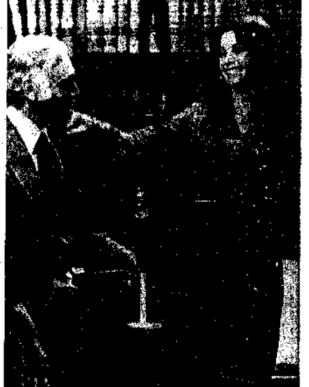
Harold Gould, en el papel de Harry Danton, «Palo» y Stefanie Powers, Toni Danton, «Astilla», en una divertida escena de la serie «Palo y Astilla».

de un cliente de «Astilla» parece exigir la entrada en acción de los especiales dotes de Harry, éste no tendrá inconveniente en volver a sus antiguos andamiajes y recabar los oficios de sus viejos compañeros de profesión, por supuesto. Dos de los compañeros