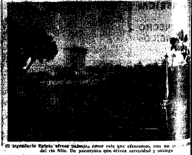
El legendario Egipto ofrece paisajes como este que ofrecen, con un panorama del río Nilo. Un panorama que ofrece serenidad y sosiego.